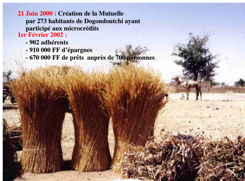
Photo 1 : bilan de la mutuelle d'épargne et crédit de Dogondoutchi

- 670 000 FF de prêts auprès de 700 personnes